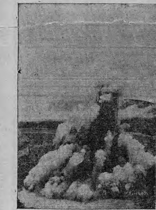
Instantáneas de una de las frecuentes erupciones del coloso; resultó un espectáculo brillantísimo.