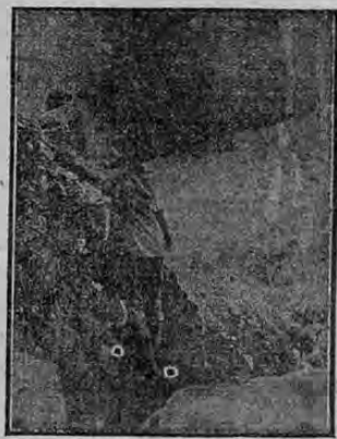
Turistas subiendo por las escarpadas rocas del volcán.

El turista que visita por primera vez el Volcán Poás, recibe la mayor sensación imaginable, porque después de una larga marcha en que se duda muchas veces si la recompensa será mayor que las dificultades habidas durante el viaje, se presenta a los ojos del viajero la vista más grandiosa e imponente. Los bordes superiores del cráter aparecen blancos, presentando el aspecto de estar nevados, tanto más que el intenso frío hace más real esta idea; luego a sus pies se abre el abismo más grandioso que descripción alguna podría ofrecer. El turista, extasiado, contempla mudo por espacio de algunos minutos aquel gran espectáculo, siendo el primer deseo el de poder presenciar alguna erupción; pues a la idea de ver levantar-se una columna de agua de aquella laguna tranquila y gris, a centenares de metros, aumenta más el ya vivo deseo de contemplar esa maravilla; desgraciadamente rara vez complace el Volcán a sus admiradores.