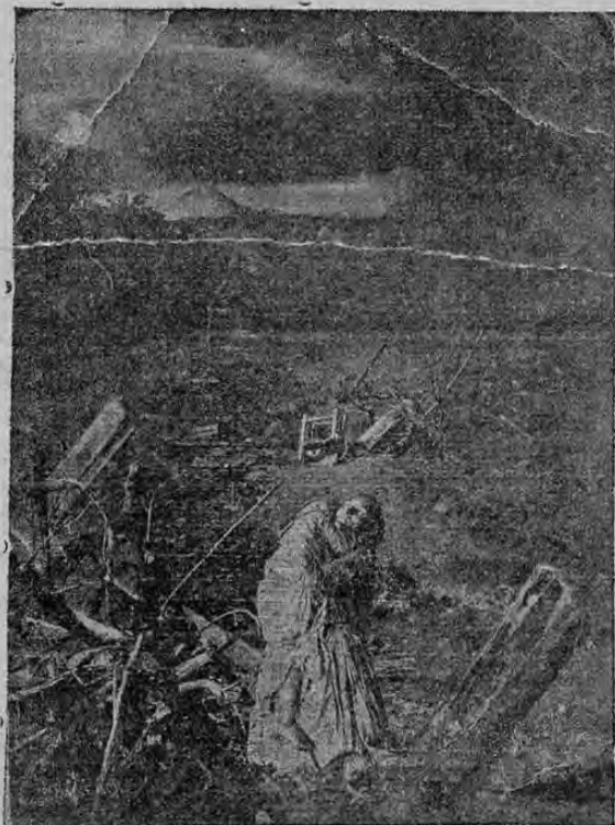
Emocionante cuadro alegórico de los estragos causados por el "Poás" en su famosa erupción en 1888.