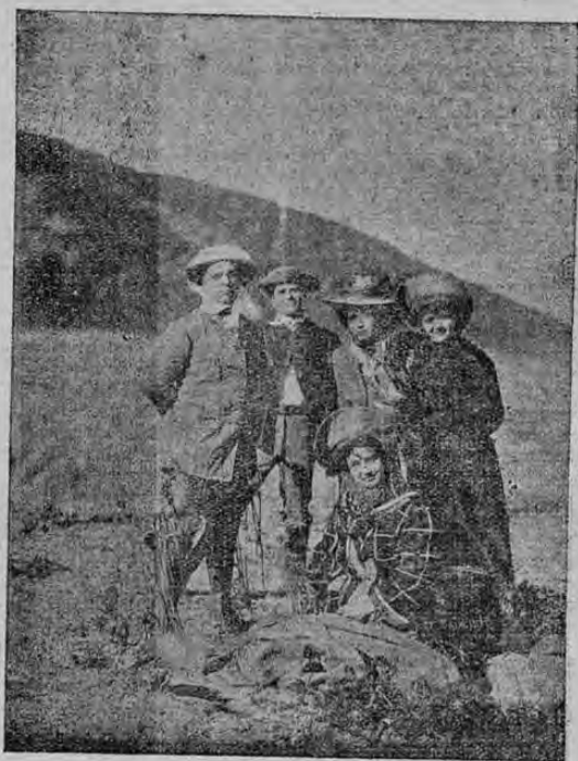
Turistas en la cumbre del volcán, contemplando brechos sus constantes erupciones.

Los árboles destruidos por las piedras y los efectos ruinosos causados por la "ceniza", son fantasías de los Corresponsales; pues como dije anteriormente, el cambio encontrado es pequinísimo. A los admiradores del Poás se les presenta una buena ocasión para presenciar pequeñas erupciones, pues dejará complacidos a aquellos que no le del Volcán", y lo que personalmente pude observar. "El agonía jueves 8 del corriente mes—