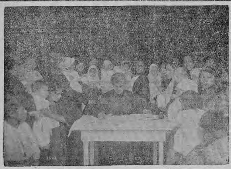
La Presidenta de la Gota de Leche matriculando los niños