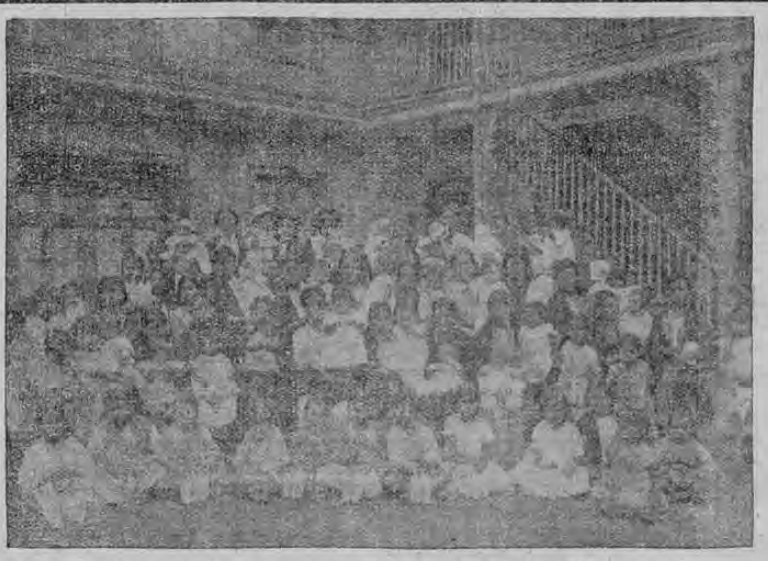
Madres y niños que reciben alimento de la Gota de Leche